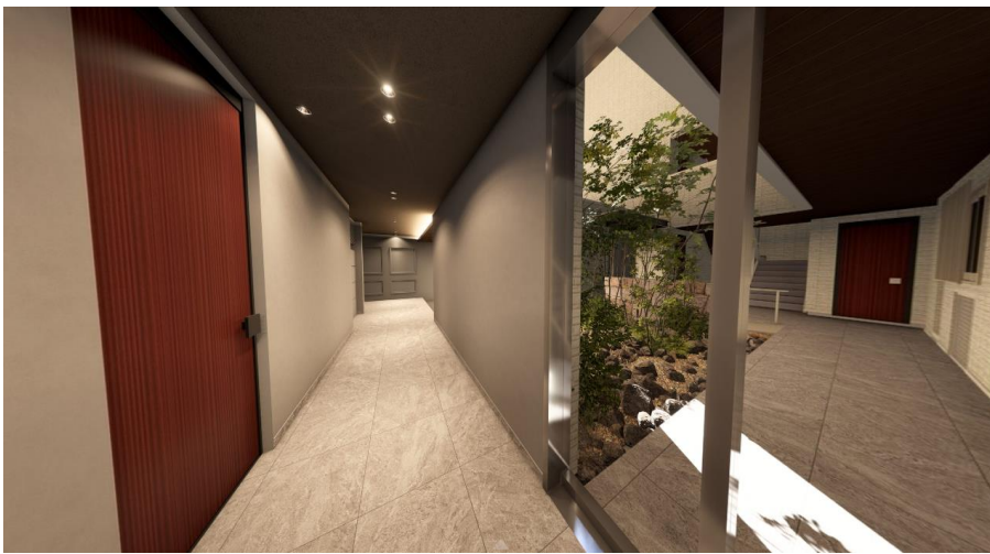
ラウンジスペースと坪庭