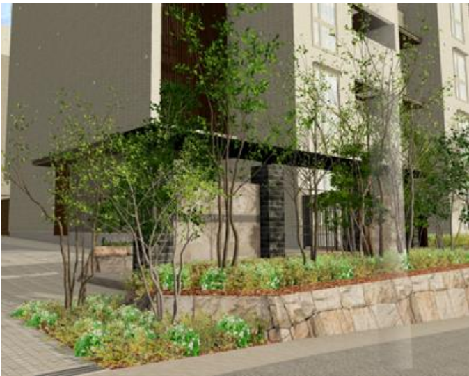
エントランス前イメージ