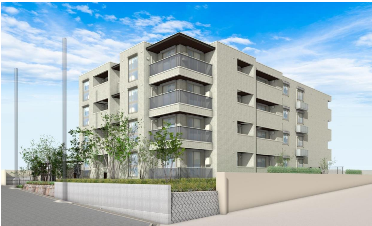
計画地の南西から望むイメージパース